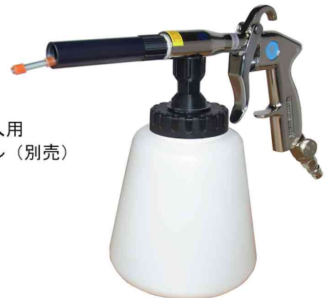
チャンバー挿入用 スライドノズル（別売）