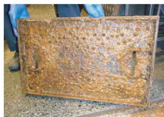
4.蓋の裏も油で汚染。