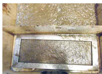
6.油が分解して発泡。