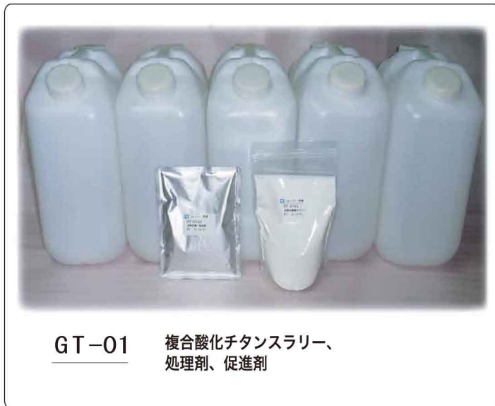
GT-01 複合酸化チタンスラリー、 処理剤、促進剤

油などで汚れたレストランのグリーストラップにGT-01を加えると、直ぐに油汚れが二酸化炭素などに分解されて急激に発泡し始めます。それと同時に、茶色の油汚れが白くなって急速に悪臭が消えます。そして、グリーストラップの縁などを軽くこすると簡単に汚れが取れ、グリーストラップの周りの汚れなどもきれいに取れて抗菌効果も得られます。