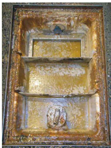
1.グリーストラップの蓋を取ったところ。