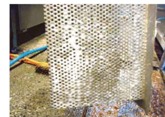
9.発泡して洗淨、浄化