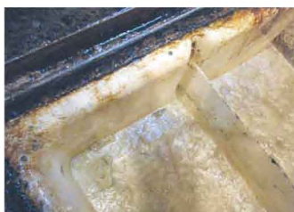
7.油汚れが除去された。