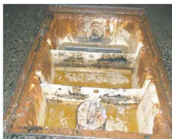
2.油が酸化して茶褐色に変化。